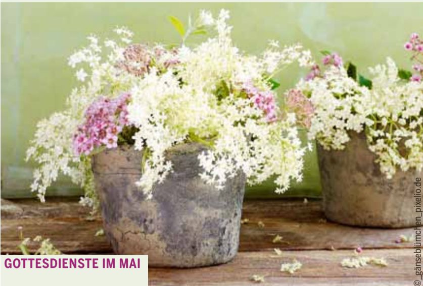
GOTTESDIENSTE IM MAI